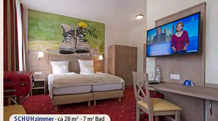
SCHUHZimmer · ca 28 m 2 · 7 m 2 Bad