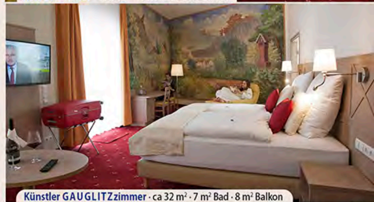
Künstler GAUGLITZzimmer · ca 32 m 2 · 7 m 2 Bad · 8 m 2 Balkon